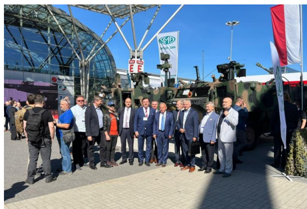
Na Targach w Kielcach